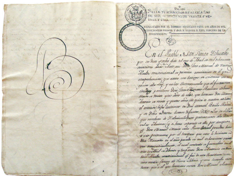
Testamento de 1823