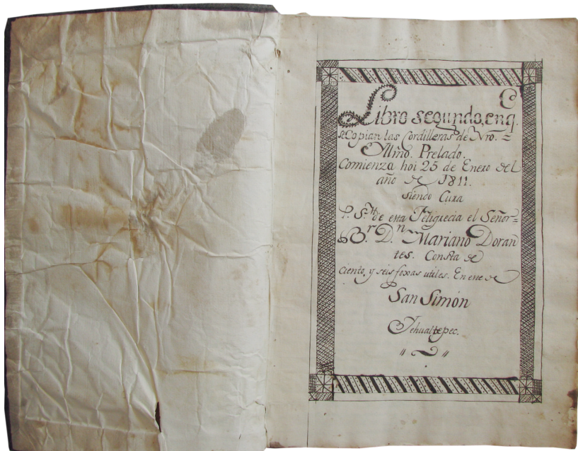
Libro de cordilleras 1811-1844