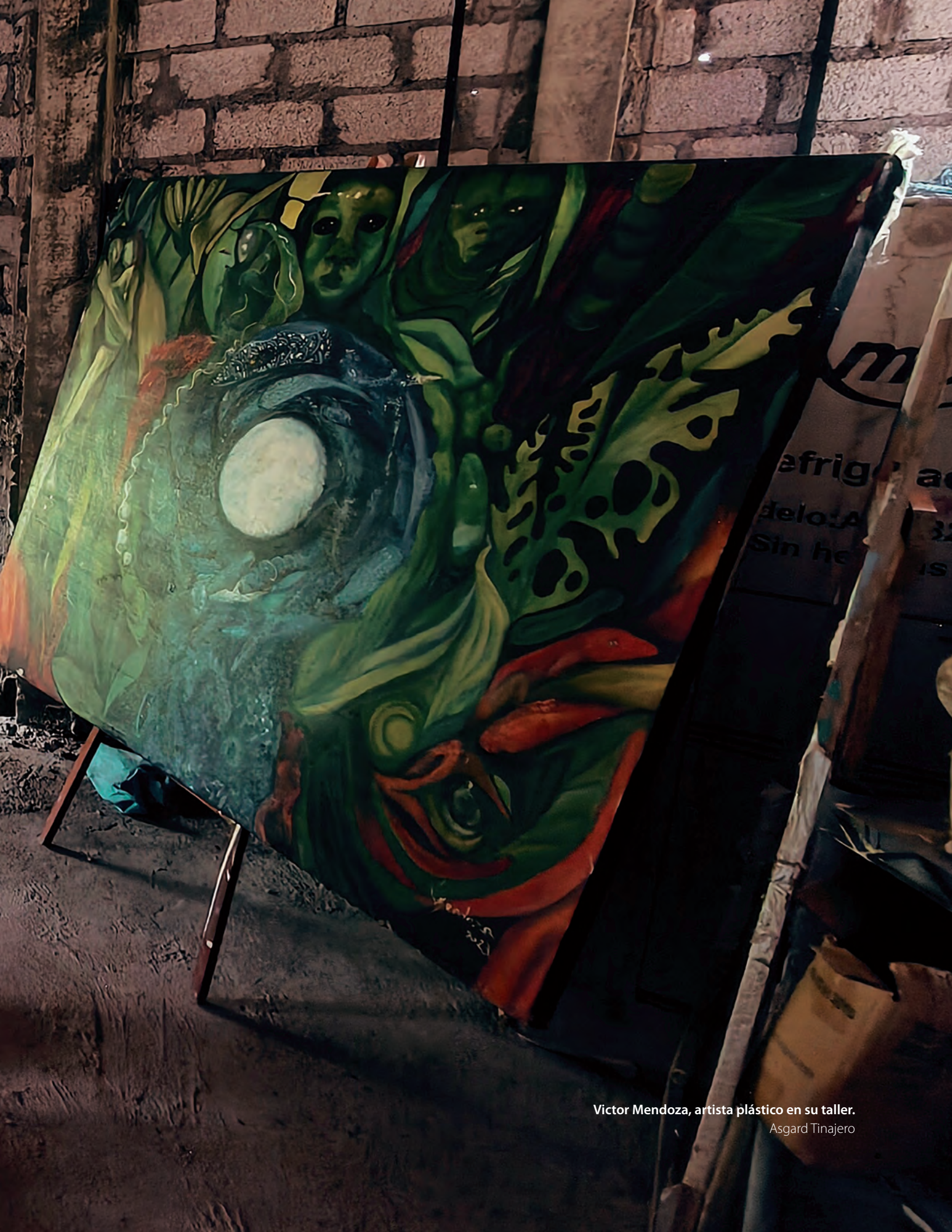
Victor Mendoza, artista plástico en su taller. Asgard Tinajero