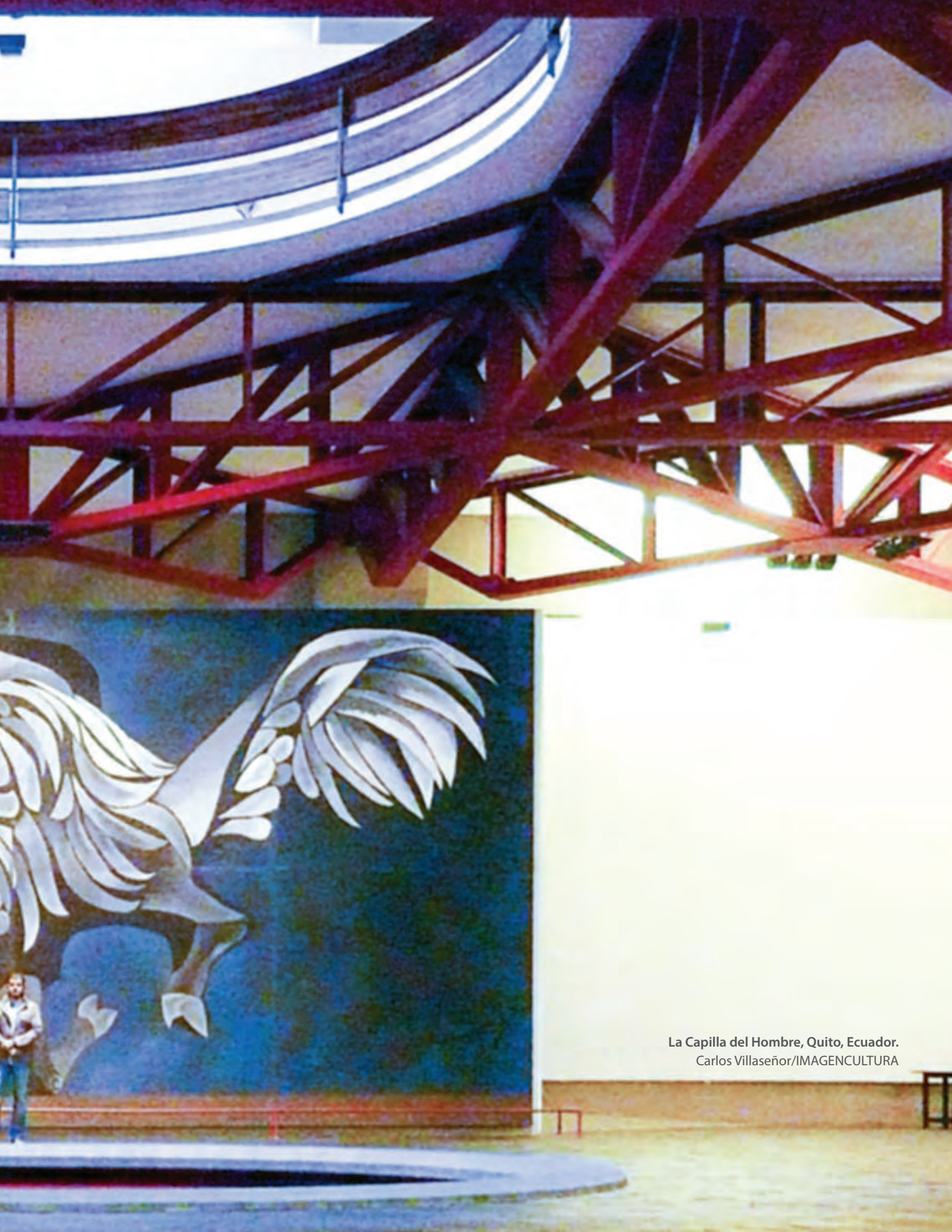
La Capilla del Hombre, Quito, Ecuador.