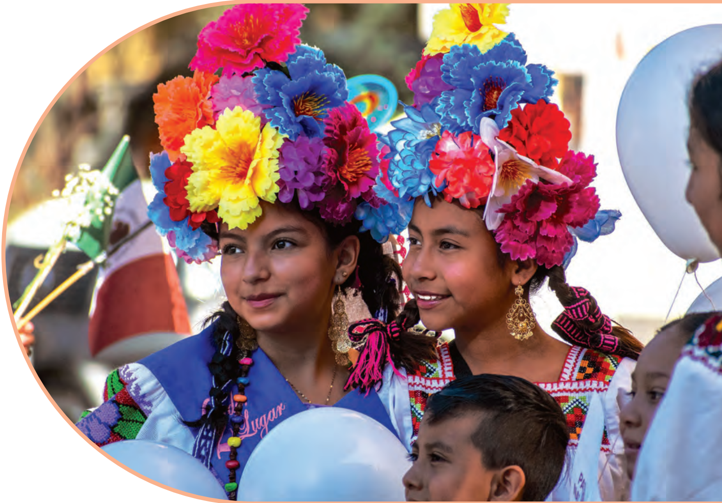
Vestimenta tradicional utilizada en fiestas de Xochimilco. UNESCO

La protección y promoción de la diversidad de las expresiones culturales presupone reconocer —por parte de la autoridad y de todas las personas— la igual dignidad de todas las culturas y el respeto de ellas , incluidas las de las personas de otros municipios o regiones, las de las minorías y las de los pueblos autóctonos.