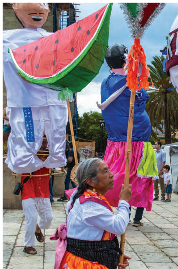
Festividades en la plaza de la Iglesia de Santo Domingo, en Oaxaca. UNESCO