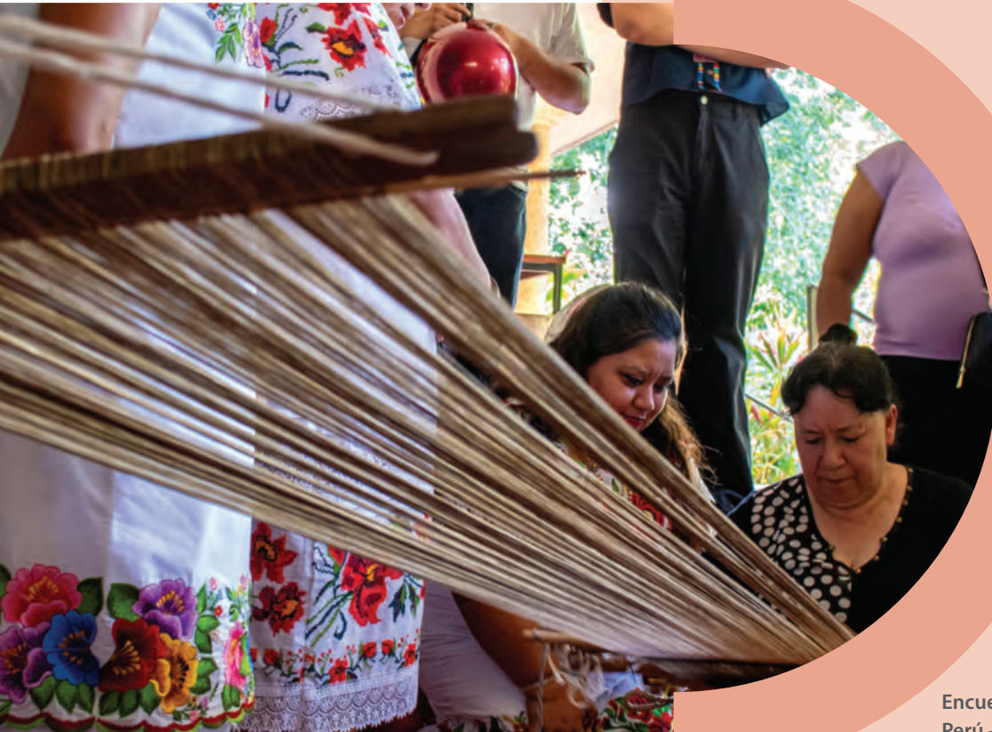
Encuentro de bordadoras, Perú – México.