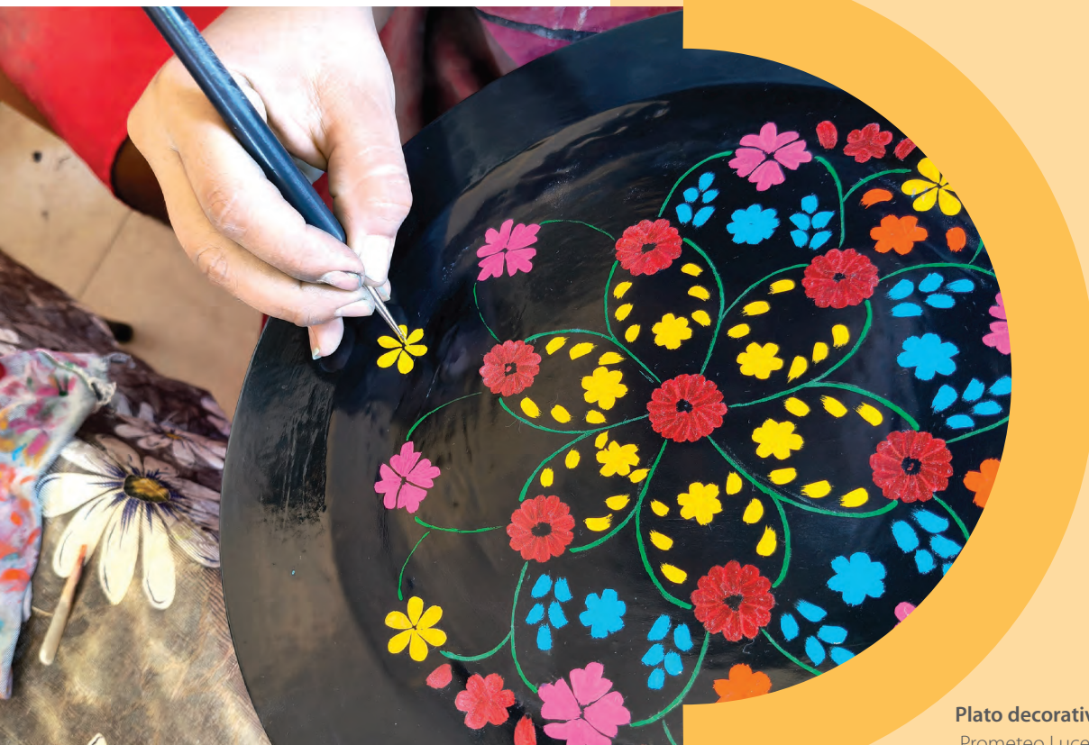
Plato decorativo de Olinalá. Prometeo Lucero

33 Las características de la política municipal de cultura, que han sido adaptadas, se localizan originalmente en la observación general 21 del Comité de los desc.