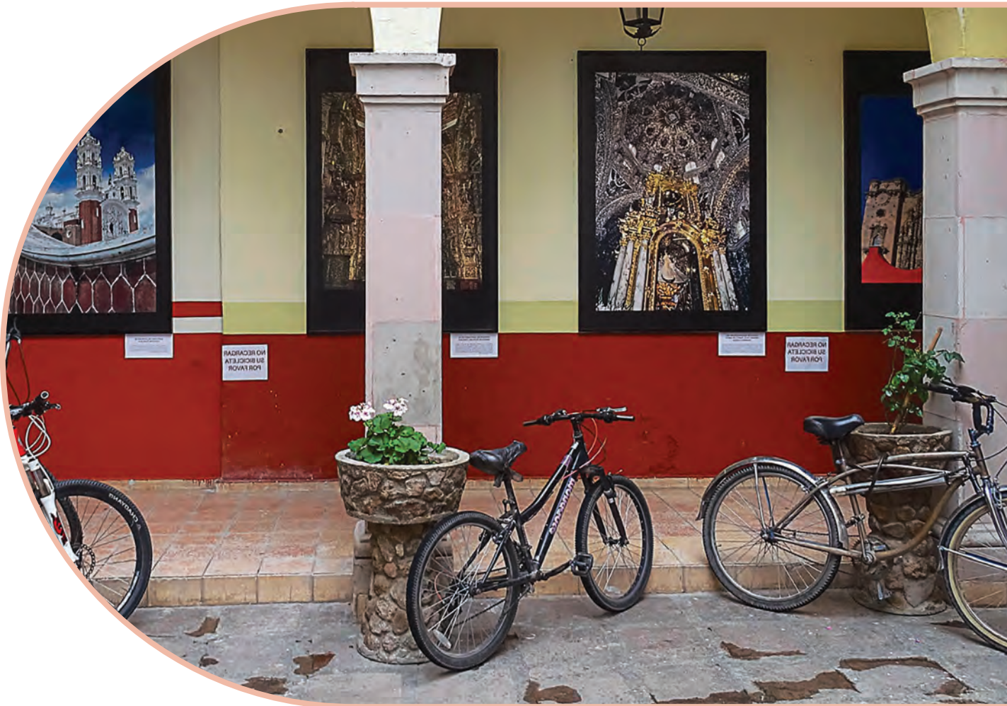
Ojocaliente, Zacatecas.

Las recomendaciones concretas proponen facilitar la implementación de principios, como parte de los programas, las políticas públicas, las acciones y las actividades culturales del municipio, en beneficio de la diversidad de las expresiones culturales y la creatividad locales.