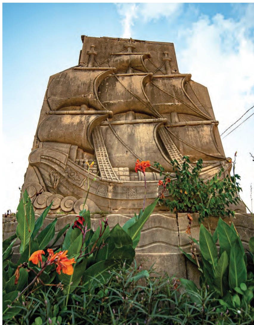
Monumento al Galeón de Manila. UNESCO