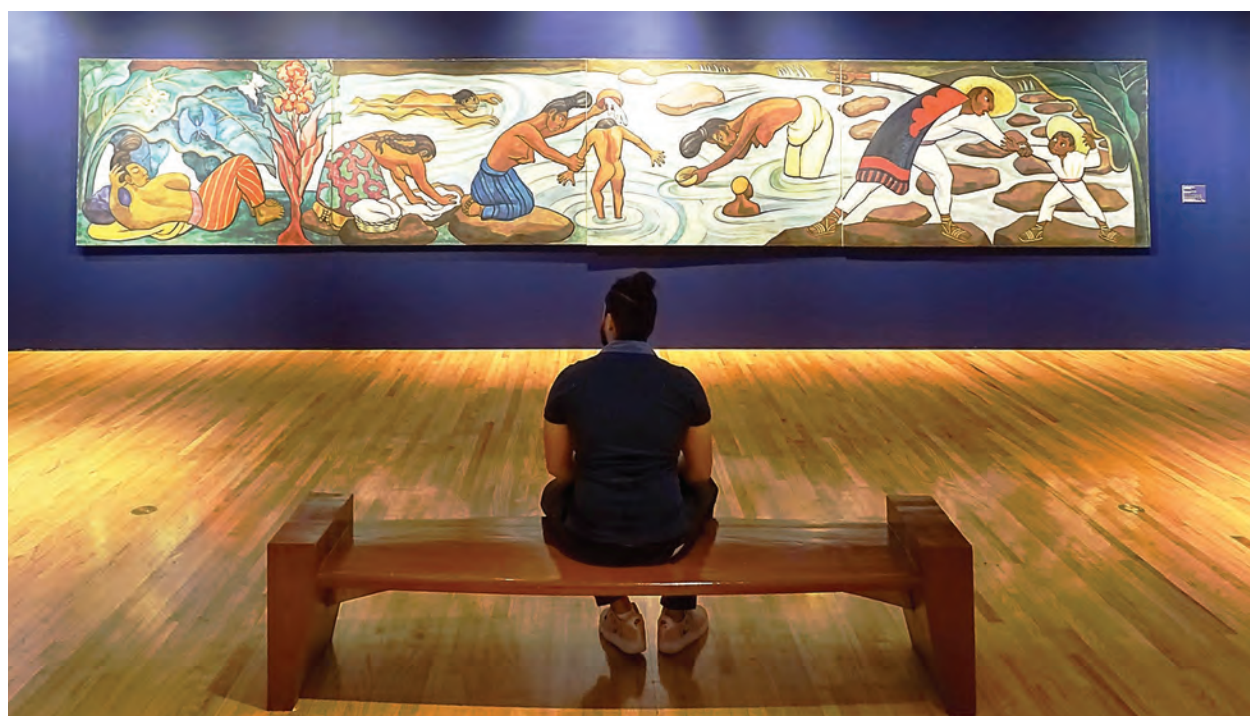
Encuentro de tiempos. MUNAL, INBAL, Ciudad de México.