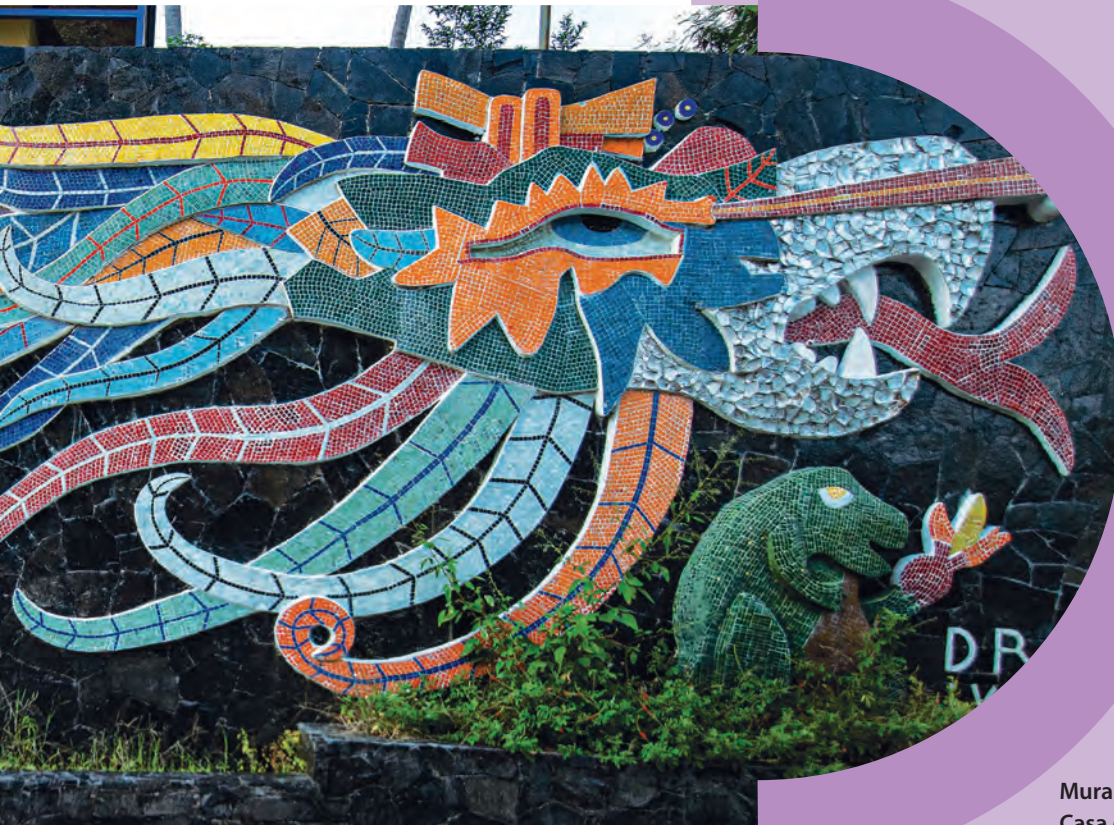
Mural Exekatlkalli, Casa de los vientos.