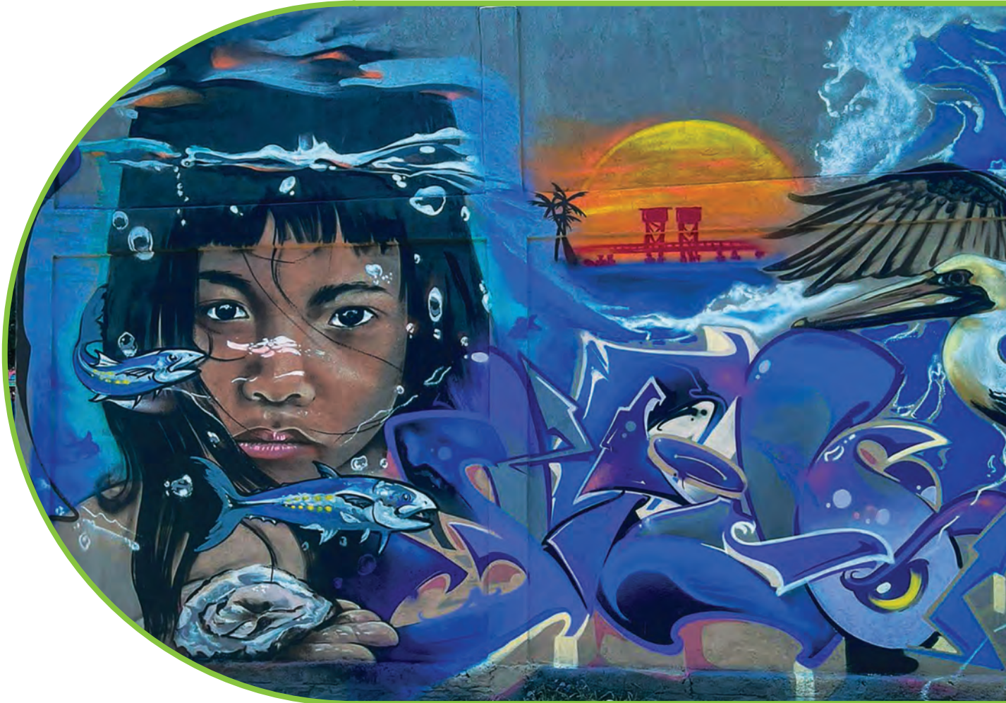
Mural en Sánchez Magallanes, Tabasco. UNESCO

En adición a su utilidad como referente para la elaboración de reglamentos y políticas culturales municipales, es previsible que la sola emisión de las recomendaciones tenga efectos positivos.