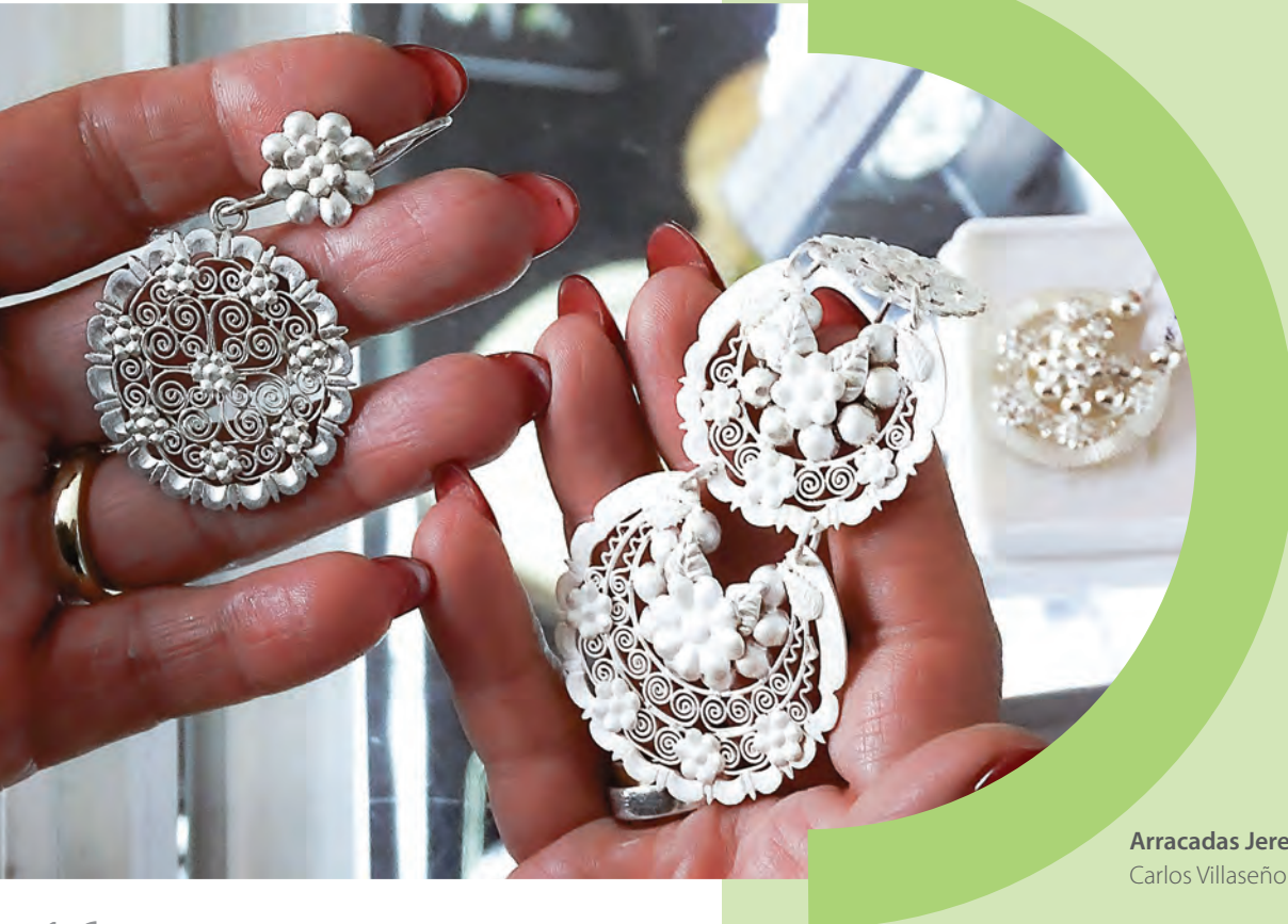
Arracadas Jerezanas, Zacatecas.