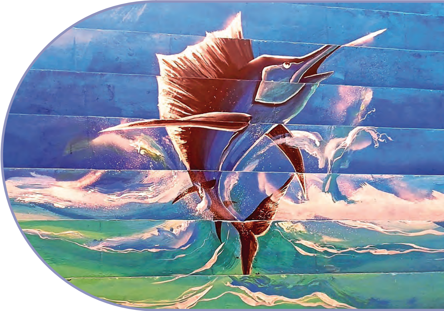
Mural en Sánchez Magallanes, Tabasco. UNESCO

Respetar y proteger el derecho de toda persona a ejercer sus propias prácticas culturales.